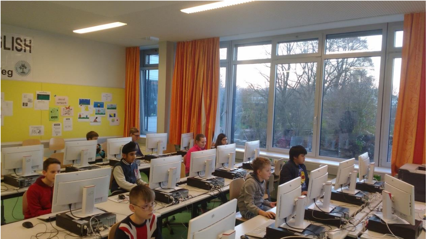
Bild: EDV Gruppe am Rudolf-Schön-Weg 1

In der unverbindlichen Übung „EDV“ lernen Ihre Kinder neben der Hardware auch einige Software-Programme kennen. Nach dem Kurs besitzen sie sichere Grundkenntnisse in: